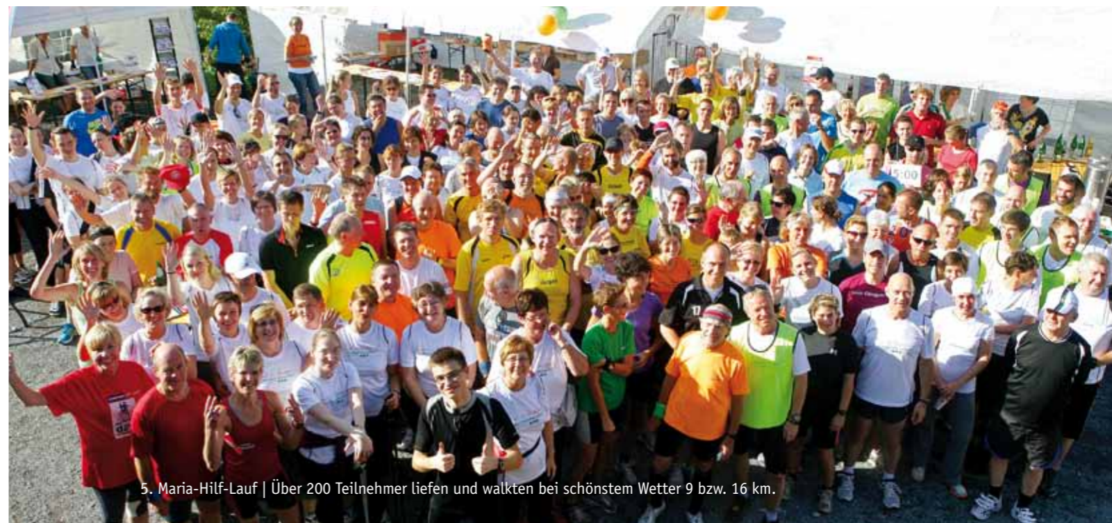
5. Maria-Hilf-Lauf | Über 200 Teilnehmer liefen und walkten bei schönstem Wetter 9 bzw. 16 km.

Die über 70 Walker bewältigen alle den neun Kilometer langen Rundlauf zwischen dem Maria Hilf und dem Franziskushaus.