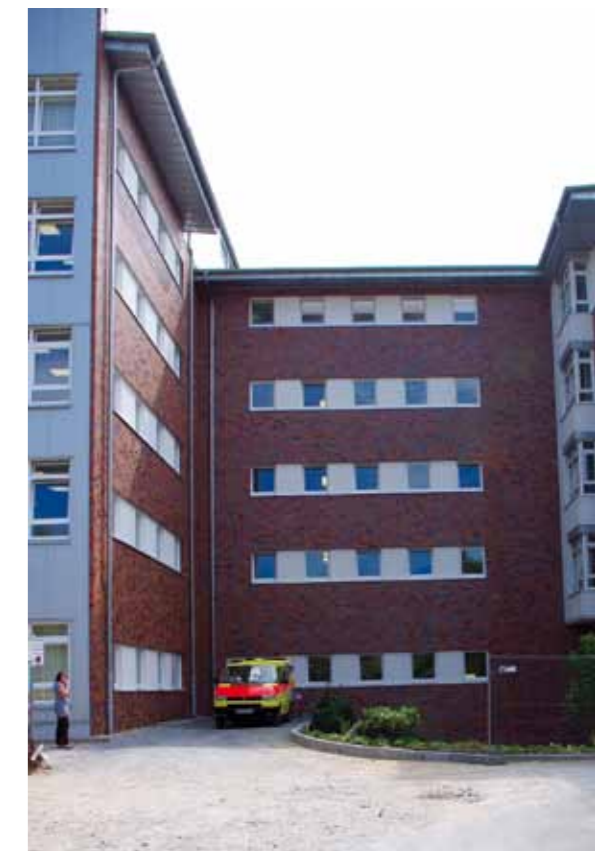
Übergangslösung für die Liegendaufnahme der Neurologie

Diese umfangreiche Aufgabe bei laufendem Klinikbetrieb ist für alle Beteiligten eine außerordentliche zusätzliche zeitliche Belastung. Diese Mammutaufgabe erscheint fast unmöglich. Sie wird nur dann leistbar sein, wenn wir uns als Maria-Hilf-Mitarbeiter mit Engagement in die Arbeitsgruppen einbringen, um so die Prozesse mit zu gestalten. Denn letztlich verfolgen wir alle das gleiche Ziel: