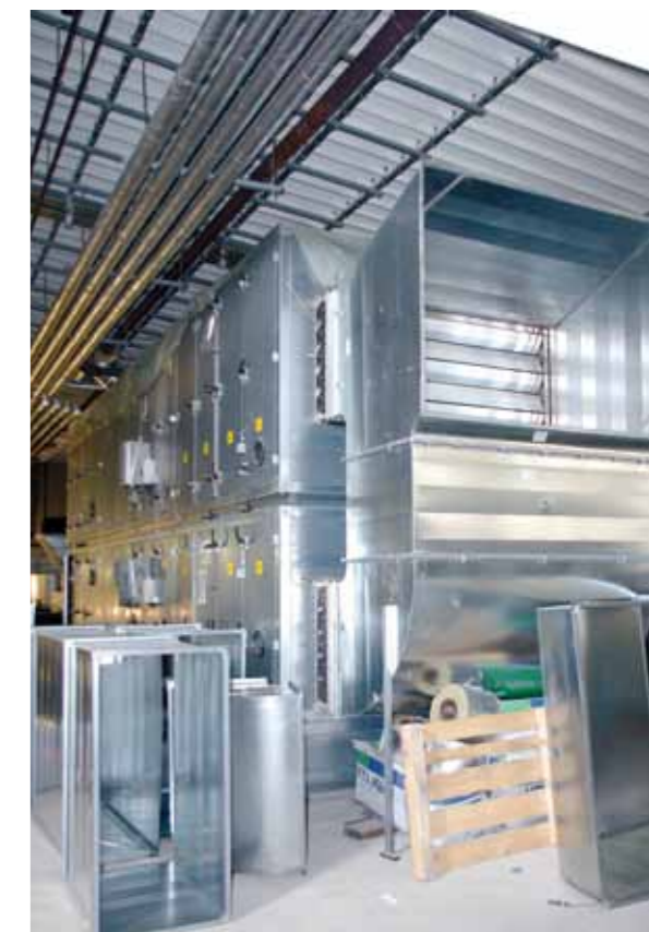
Technikzentrale über der ITS