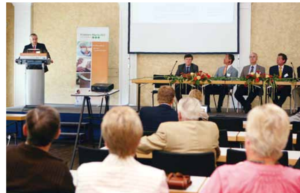
Fachexperten des Onkologischen Zentrums beantworteten während der Veranstaltung Fragen zu verschiedenen Krebserkrankungen.

Rund 40 Teilnehmer, überwiegend Betroffene und Angehörige, erfuhr einen Wissenswertes über Tumore im