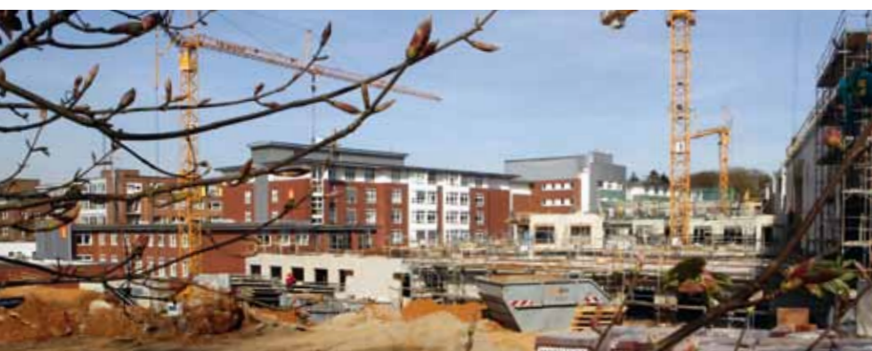
Sichtbarer Baufortschritt von August 2010 (oben) bis August 2011 (unten) ...