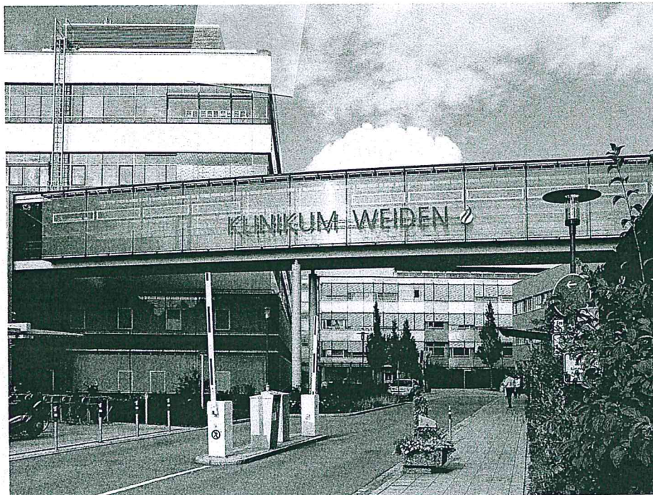
Klinikum Weiden Prostatazentrum, Kontinenz-/Beckenbodenzentrum, männliche Zeugungs- und Potenzstörungen - die Weidener Urologen bieten ein breites Spektrum