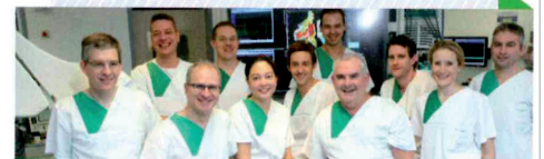
Das Leitungsteam der Kardiologie.