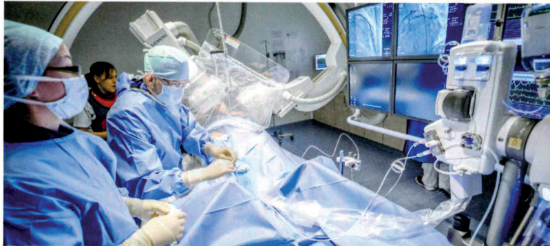
Steriles Arbeiten im modernen Herzkatheterlabor des Krankenhauses St. Franziskus

einzigartig in Mönchengladbach. Im speziell eingerichteten Herzrhythmuslabor (sog. Elektrophysiologisches Labor) führen die Ärzte der Abteilung mit großer Routine mittlerweile Ablationen bei allen Formen von Herzrhythmusstörungen (supraventrikuläre/ventrikuläre Tachykardien inkl. Vorhofflimmern) durch.